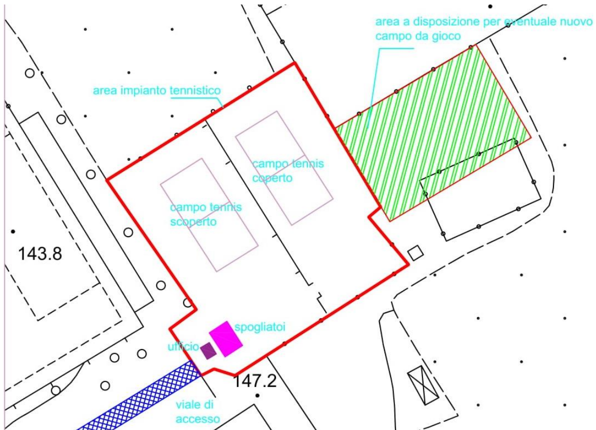
Planimetria impianti tennis