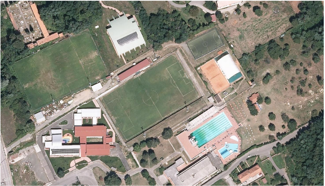
Vista Aerea Complesso Sportivo Villaspport