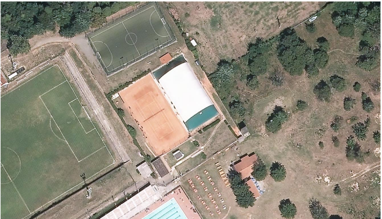
Vista Aerea particolare impianti tennis